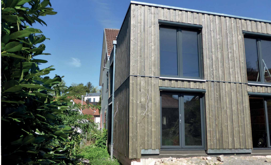
Um- und Anbau